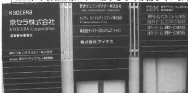
現在の正門の看板 京セラが大家で、IBMは店子に

看板が京セラに変わってから地域の人から「IBM社員はいなくなったのか?」と聞かれました。現在IBM、子会社は京セラの店子として存続しています。